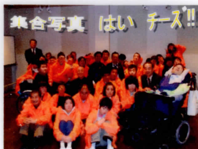
集合写真 はい チーズ!!