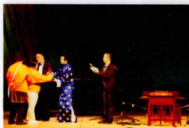
チャリティーコンサートもたくさんの